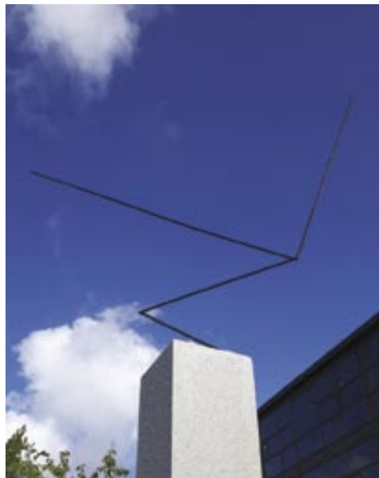
3. XUG (replik), 2004 (1968) stål, höjd 307 cm

Bærtling reducerade kompositionselementen i sin skulptur till att endast bestå av några smäckra linjer i stål. Men ur dessa linjer bildas trianglar som med kraft kastas ut åt olika håll. Bærtling modererade vinklarnas grader med hög precision för att uppnå dess maximala effekt.