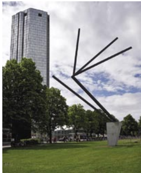
1. ASAMK (replik), 2004 (1961) stål, höjd 15 m

Men det är en replik av just ASAMK, ca 15 meter hög, som nu står här vid kvarteret Bærtling i Halmstad, dock utan hiss. Aldrig skulle väl Bærtling tro att hans skulptur skulle uppföras just här, i hans hemstad. Nog verkar det som om att Olle Bærtling håller på att få rätt när han beskriver framtidens städer. Det ger en fingervisning om hur långt före sin tid hans tankar var.