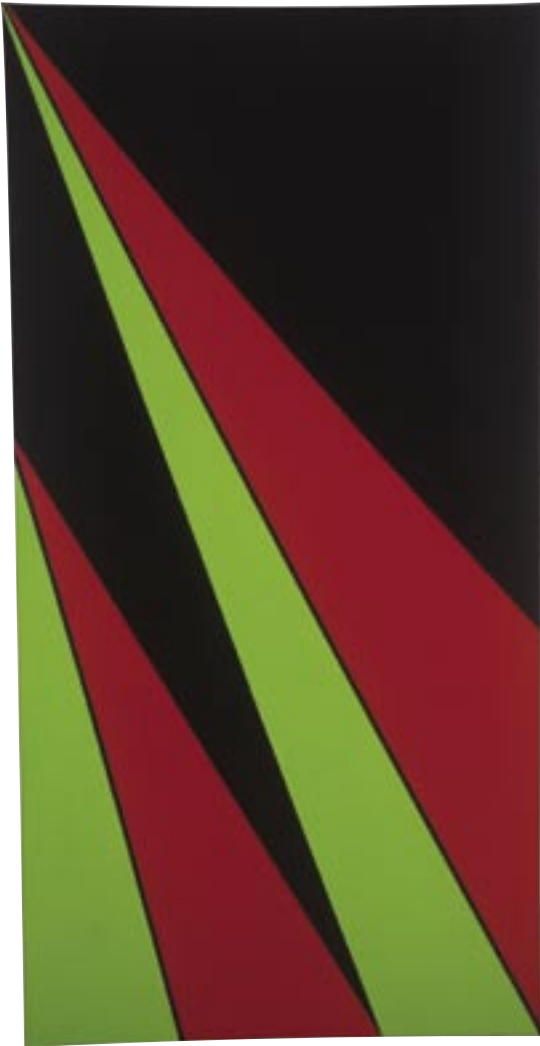
5. Aguiba Olle Bærtling, Aguiba , 1958, olja på duk, 180 x 92 cm

Abstraktionen var Olle Bærtlings utgångspunkt. Allt som kunde associeras med naturen eller något materiellt var strängt förbjudet. Vi ser inte ens spåren av penselns arbete på duken. Med denna immaterialisering av det fysiska verket ville Bærtling sätta vår konventionella syn på konst ur spel och låta verkets andliga innehåll föra oss ut i okända dimensioner.