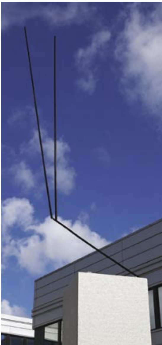
2. XUE, 1968 stål, höjd 560 cm

Bærtling reducerade kompositionselementen i sin skulptur till att endast bestå av några smäckra linjer i stål. Men ur dessa linjer bildas trianglar som med kraft kastas ut åt olika håll. Bærtling modererade vinklarnas grader med hög precision för att uppnå dess maximala effekt.