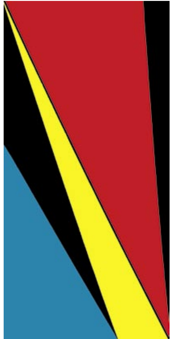
6. Irgur Olle Bærtling, Irgur , 1958, olja på duk, 195 x 97 cm

Abstraktionen var Olle Bærtlings utgångspunkt. Allt som kunde associeras med naturen eller något materiellt var strängt förbjudet. Vi ser inte ens spåren av penselns arbete på duken. Med denna immaterialisering av det fysiska verket ville Bærtling sätta vår konventionella syn på konst ur spel och låta verkets andliga innehåll föra oss ut i okända dimensioner.